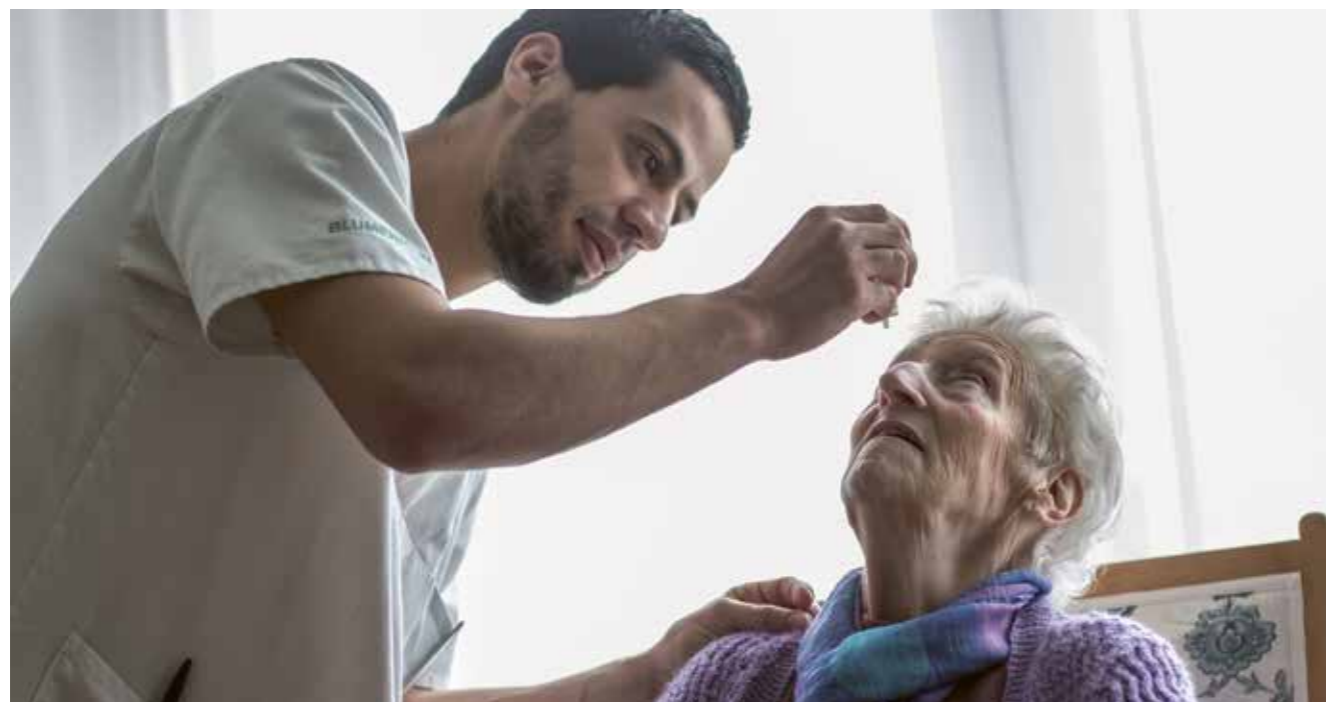
Gemeinsam für die Pflege. Die Pflgetaxe ist kantonal geregelt und der finanzielle Aufwand wird unter der Gemeinde, der Krankenkasse und der pflegebedürftigen Person aufgeteilt.