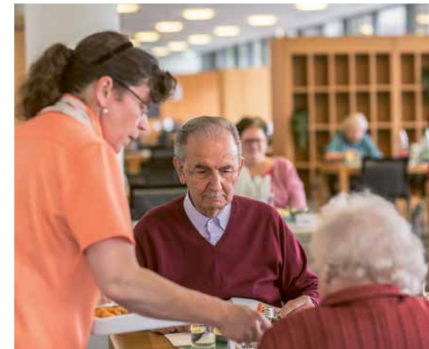
Spitex oder Pflegeheim? Wenn es um die Betreuung geht, sind individuelle Lösungen gefragt, die für alle Beteiligten stimmig sind.