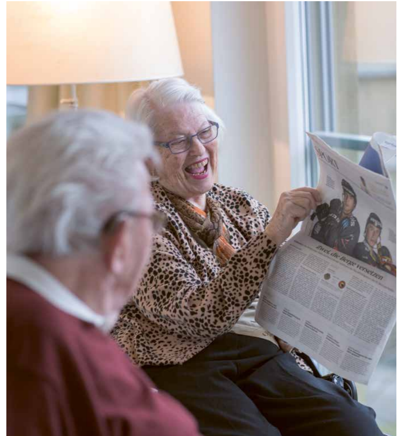
Viele Menschen über 80 Jahre leben noch selbstständig – deshalb ist es umso wichtiger, dass die Lebensfreude auch bleibt, wenn der Weg ins betreute Wohnen führt.