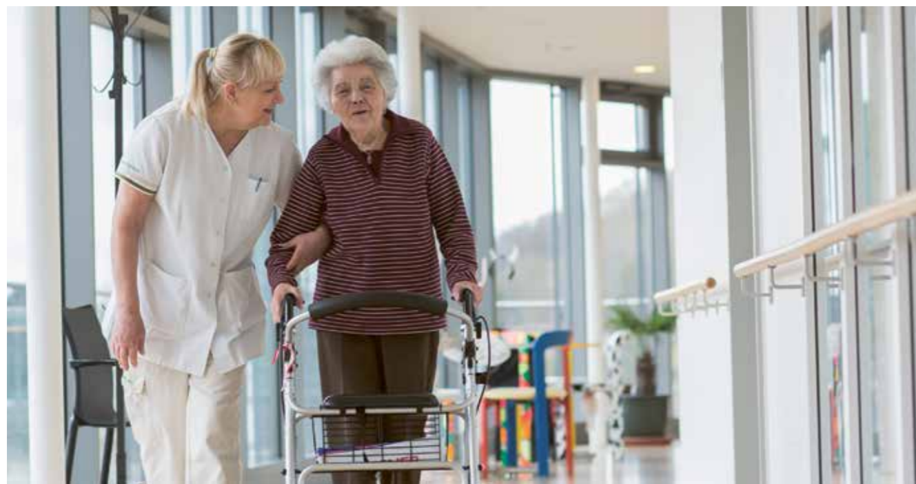
Umfassende Betreuung und Pflege rund um die Uhr – die Kosten eines modernen Alterszentrums orientieren sich am Angebot, welches die Bewohnerinnen und Bewohner erwarten dürfen.